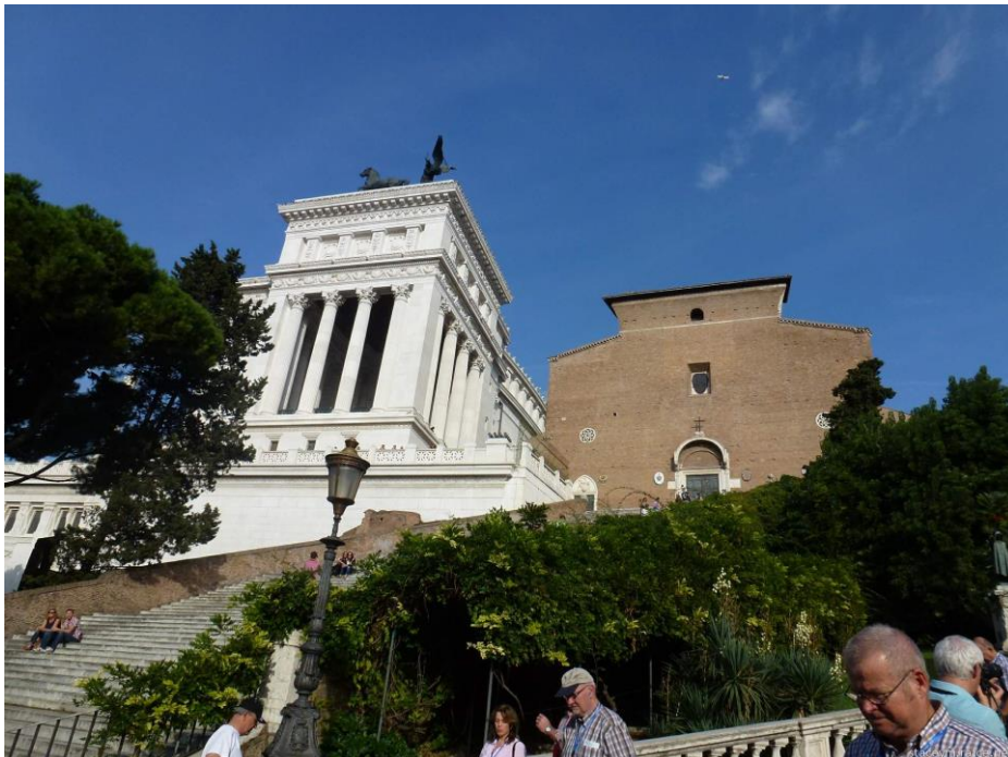
Bazilika S. Maria d'Aracoeli nalazi se danas na brežuljku iza Oltara domovine (Prilaznih stuba do glavnog ulaza u Baziliku je 122 s lijeve strane a 124 s desne)

Na tome mjestu u XII. i XIII. stoljeću sagrađena je crkva Basilica Santa Maria in Araecoli .