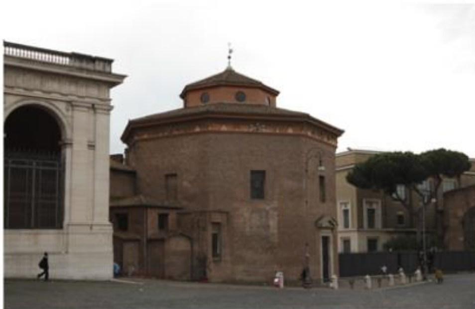
Krstionica sv. Ivana Lateranskog

U sklopu crkve, nalazi se krstionica (krsni zdenac) iz početaka kršćanstva, kada se obred krštenja obavljao uranjanjem u vodu.