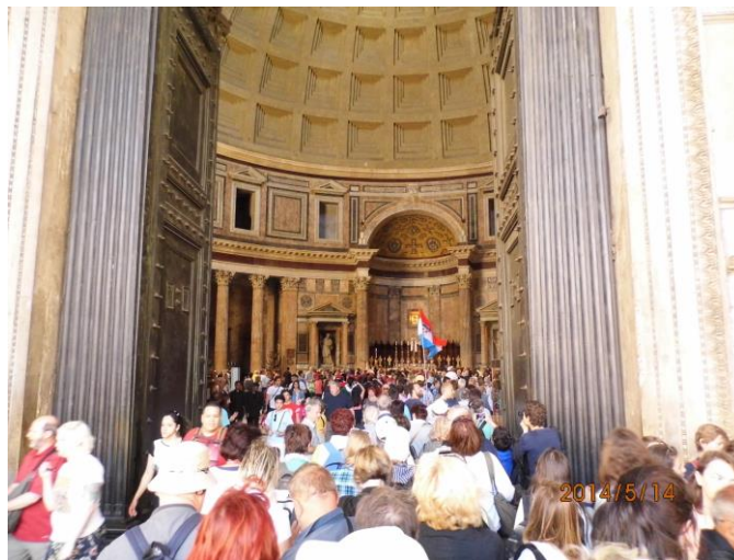
Razgledavanje Panteona koji je danas Bazilika svete Marije od mučenika

Sveti Otac je u svojem kratkom nagovoru hodočasnicima govorio o četvrtom daru Duha Svetoga - Jakosti. Ovaj papa govori samo talijanski, tako da je njegov nagovor naknadno preveden na tek pet svjetskih jezika. No, papa je ovaj puta načinio izuzetak, svoje zemljake koji su došli u Vatikan iz daleke Argentine, pozdravio je španjolskom jeziku. Audijencija je završila zajedničkom molitvom Oče naš, kojeg su svi hodočasnici izmolili na latinskom jeziku (tekst su svi hodočasnici dobili na poledini ulaznice za sudjelovanje na Audijenciji) i apostolskim blagoslovom pape Franje. Na audijenciji su bili brojni hodočasnici iz Italije, Francuske, Njemačke, Španjolske, Portugala, Slovačke, Poljske, Austrije, Meksika, Brazila, Argentine, Japana, Kine, Tunisa, afričkih i azijskih država. Po završetku Audijencije dobili smo informaciju da ja istoj nazočilo oko 200.000 hodočasnika.