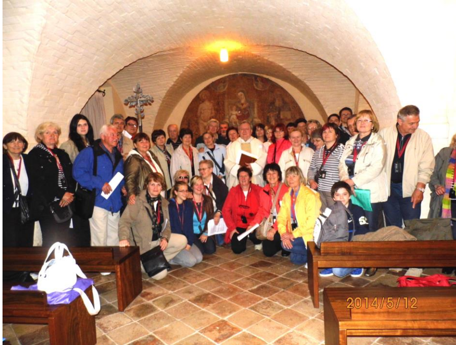
Naši hodočasnici nakon svete mise u Bazilici Svete Marije anđeoske

Porcijunkula ili Sv. Marija Anđeoska maleno je zemljište s crkvicom nedaleko Asiza koje je 1209. godine sv. Franjo dobio od asiških benediktinaca za boravište svoje braće. Crkvice Porcijunkula nalazi se danas unutar bazilike Sv. Marije Anđeoske koja je građena po nalogu pape Pija V. od 1569. do 1679. godine. Papa Pio X. uzdigao je baziliku na čast papinske bazilike nazivajući je "Majka i Glava svih crkava Franjevačkog reda".