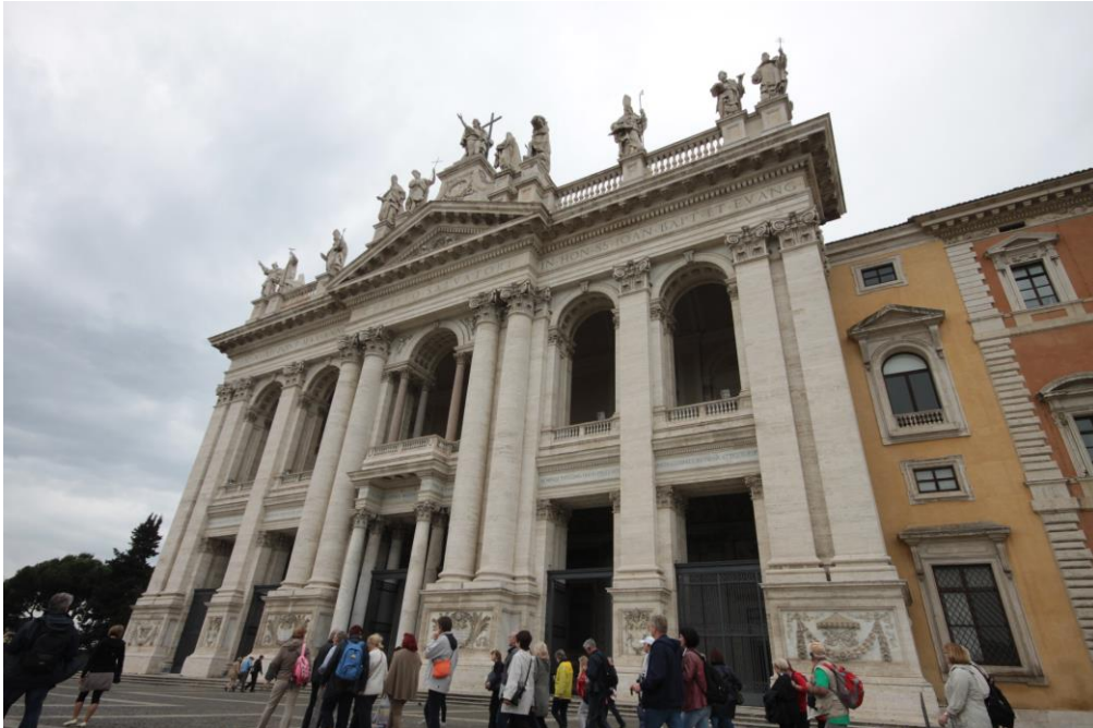
Ulaz hodočasnika u Baziliku sv. Ivana Lateranskog

Drugi dan hodočašća, utorak 13. svibnja, hodočasnici su pohodili sve velike bazilike Vječnoga Grada. Počelo je ujutro, uz laganu kišu, koja nije omela pobožan obilazak svetih mjesta.