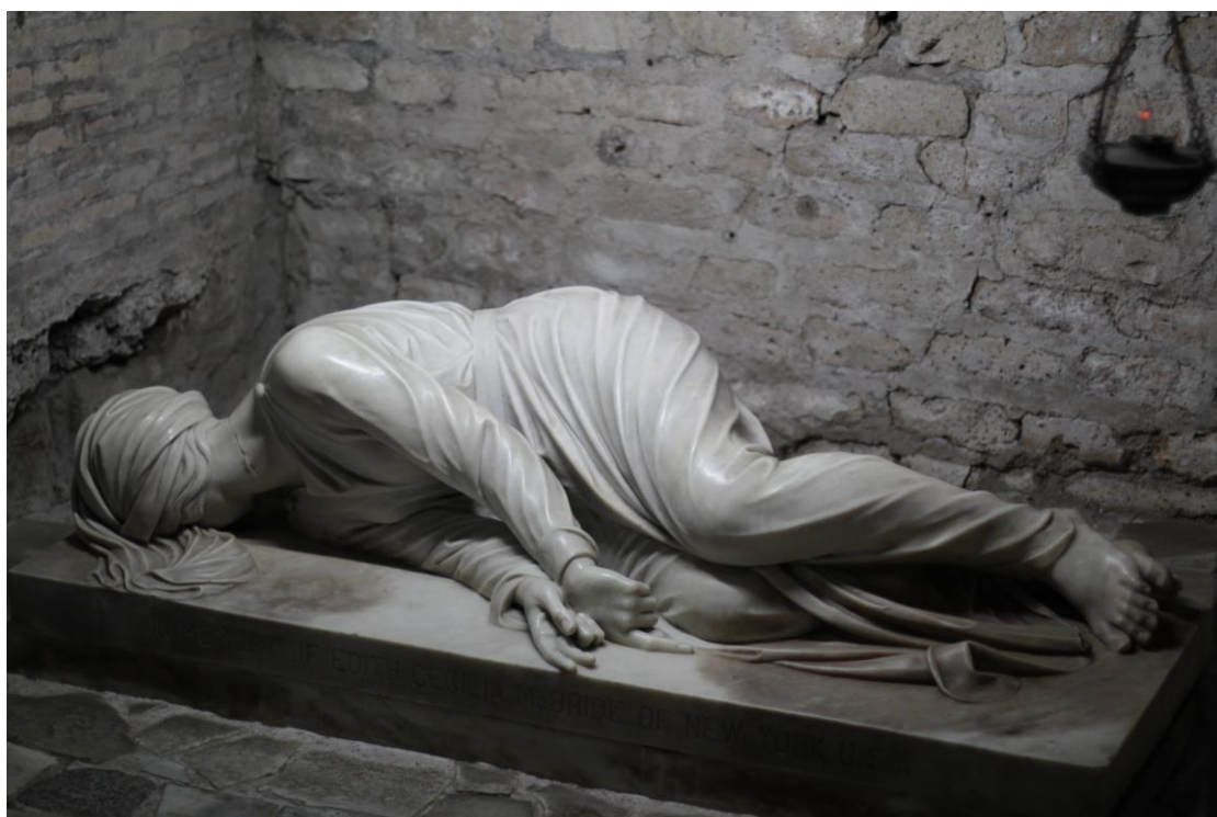
Grob svete Cecilije, zaštitnice crkvenih pjevača i glazbenika

Na kraju dana slijedi pohod Katakombama svetog Kalista , do kojih se dolazi ulicom Via Apia u kojoj se nalazi i Crkva Quo vadis Domine? .