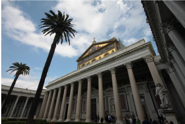
Bazilika svetog Pavla izvan zidina

zaštitnika sve nesretne djece. Običaj je da nesretno dijete napiše pisamce sa svojom željom i ostavi pored kipa, a Santo Bambino se brine da se te želje ostvare. S Kapitola se spuštaju stepenice na Trg Venecijana, gdje se nalazi monumentalno zdanje Oltara domovine sa spomenikom neznatome junaku i vječnom vatrom. Neorenesansna je građevina, podignuta u čast Emanuelu II., tvorcu ujedinjene Italije.