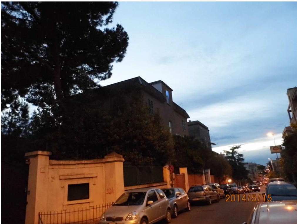
Dom hrvatskih hodočasnika „Ivan Merz“ u Rimu

U ranim poslijepodnevним satima hodočasnici su stigli u Rim i smjestili se u Domu hrvatskih hodočasnika „Ivan Merz“ u Rimu.