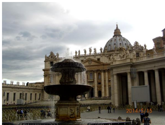
Papinska bazilika sv. Petra u Vatikanu

Bazilika sv. Petra (tal. Basilica Papale di San Pietro in Vaticano) je vatikanska crkva izgrađena u stilu klasične renesanse, na mjestu prethodne ranokršćanske bazilike. Prema tradiciji i povijesnim izvorima, prvo zdanje podignuto je na mjestu mučeništva i grobu sv. Petra, jednog od dvanaest apostola i prema katoličkoj tradiciji prvog rimskog biskupa, a time i prvog u nizu papa. Smatra ju se jedinstvenom crkvom u kršćanskom svijetu, kao i najvažnijom od svih kršćanskih crkava. Iznad groba sv. Petra, u 16. stoljeću, sagrađena je prekrasna bazilika njemu u čast. Brojni znameniti umjetnici Italije, među kojima su Donato Bramante, Gianlorenzo Bernini i Michelangelo bili su uključeni u njenu izgradnju od 1506. do 1626. Danas je zbog svojih religijske i povijesne važnosti vezane uz papinstvo, protureformaciju, te umjetnike i arhitekte značajno hodočasničko i turističko središte.