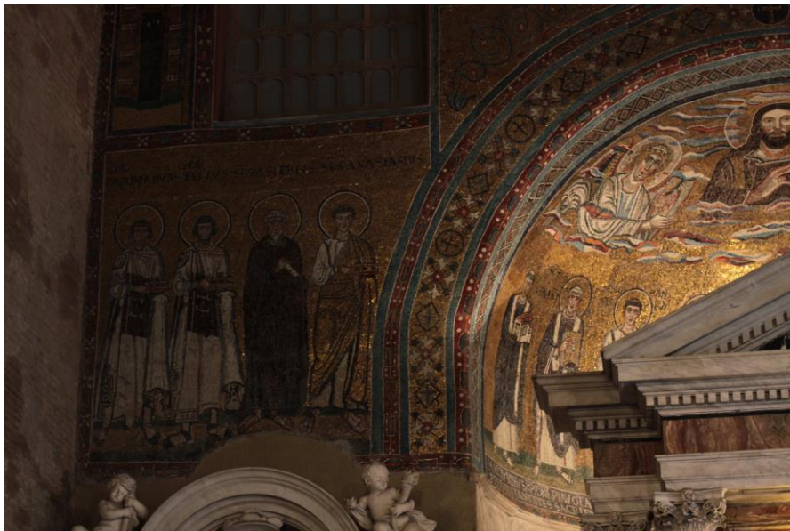
Mozaik s prikazom Solinskih mučenika u Bazilici sv. Ivana Lateranskog

Bazilika Svetog Ivana na Lateranu službeno je crkveno sjedište rimskog biskupa, tj. pape. Službeni naziv na latinskome glasi: Archibasilica Sanctissimi Salvatoris et sancti et Iohannes Baptista Evangelista in Laterano (hrvatski: Arhibazilika Presvetog Spasitelja, Svetog Ivana Krstitelja i Svetog Ivana Evanđelista na Lateranu ). To je najstarija i prva po važnosti (kao rimska katedrala) među četiri velike (papinske) bazilike u Rimu, i nosi počasni naslov Omnium urbis et orbis ecclesiarum mater et caput (lat., majka i glava svih crkava u Rimu i u cijelom svijetu ).