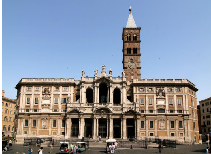
Bazilika svete Marije Velike u Rimu

Bazilika svete Marije Velike (talijanski: Basilica di Santa Maria Maggiore ) antička je katolička bazilika u Rimu, građena u starokršćanskom stilu. Jedna je od četiri velike ili papinske bazilike koje su se nekad označavale, zajedno s Bazilikom Sv. Lovre izvan zidina, pet "patrijarhalnih bazilika" Rima, povezana s pet drevnih patrijarhalnih sjedišta kršćanstva (Pentarhija). Ostale tri papinske ili velike bazilike su: bazilika sv. Petra, bazilika sv. Ivana Lateranskog i bazilika sv. Pavla izvan zidina. Nalazi u blizini željezničkoga kolodvora. Strop Bazilike je izrađen od zlata donesenoga iz Španjolske, pa se nazivu crkve dodaje i epitet "izrađena od zlata". I danas je utočište španjolskih redovnika. Za nas Hrvate je značajna jer se u njoj nalazi i kapela Pape Sixta V., koji je podrijetlom iz Dalmacije i koji je mnogo učinio za izgradnju tadašnjega Rima.