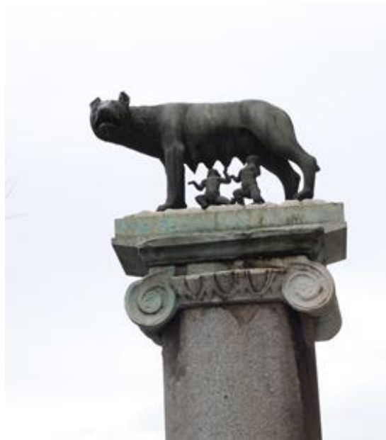
Romul, Rem i vučica

se nalazi spomenik Romulu, Remu i vučici koja ih je, prema legendi, othranila (originalna se skulptura nalazi u muzeju na samome Trgu).