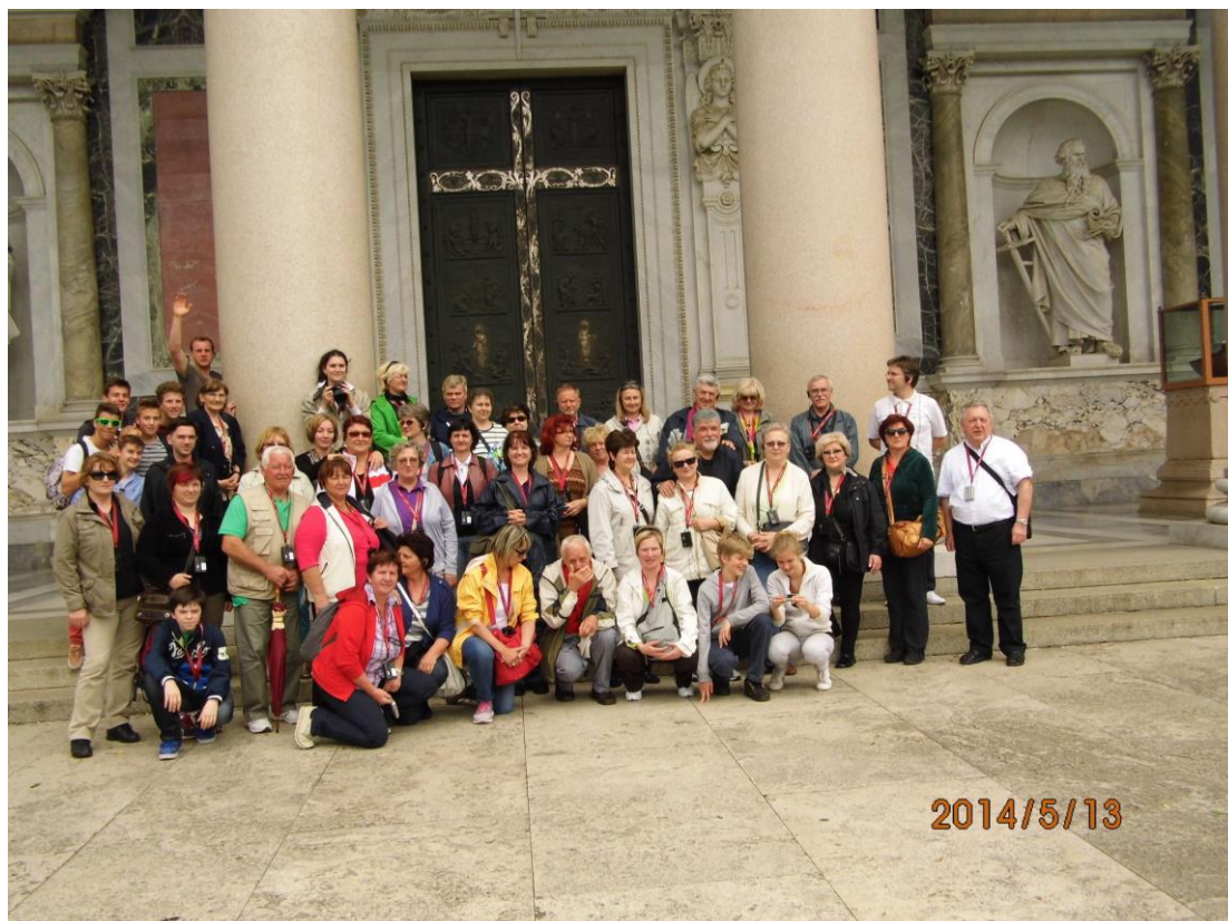
Naši hodočasnici ispred Bazilike sv. Pavla izvan zidina

Na kraju dana slijedi pohod Katakombama svetog Kalista , do kojih se dolazi ulicom Via Apia u kojoj se nalazi i Crkva Quo vadis Domine? .