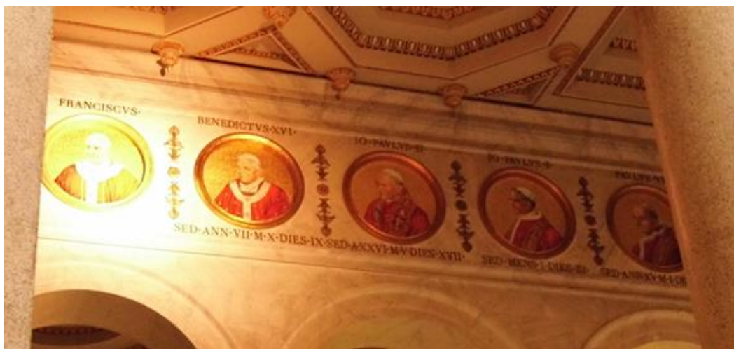
Portreti papa: Franjo, Benedikt XVI., Ivan Pavao II., Ivan Pavao I., Pavao VI.,... ..

Nakon podnevnog odmora slijedio je pohod Bazilici svetoga Pavla izvan zidina ( Basilica di S. Paulo fuori le mura). Rimski car Konstantin, koji je postao prvim kršćanskim vladarom, podigao je na mjestu mučeništva svetoga Pavla apostola prvu baziliku i smjestio njegove relikvije u grobnicu. Sama se bazilika proširuje i dograđuje u XVI. i XVII. stoljeću. U velikom je požaru 1823. godine gotovo sve do temelja izgorjela. Tada se obnavlja uz pomoć mnogih vladara, čak i s Istoka, a zanimljivo je da je i naš đakovački biskup Josip Juraj Štrosmajer dao drvo iz slavonskih šuma za izradu drvenih dijelova u crkvi. Ono što se sada vidi potječe iz toga razdoblja i djelo je baroknih majstora uz najljepši gotički baldahin iznad oltara. A jedna je od zanimljivosti da se na unutarnjim zidovima nalaze naslikani portreti svih papa, od prvoga pape sv. Petra pa do sadašnjeg pape Franje, čiji je portret posebno osvijetljen.