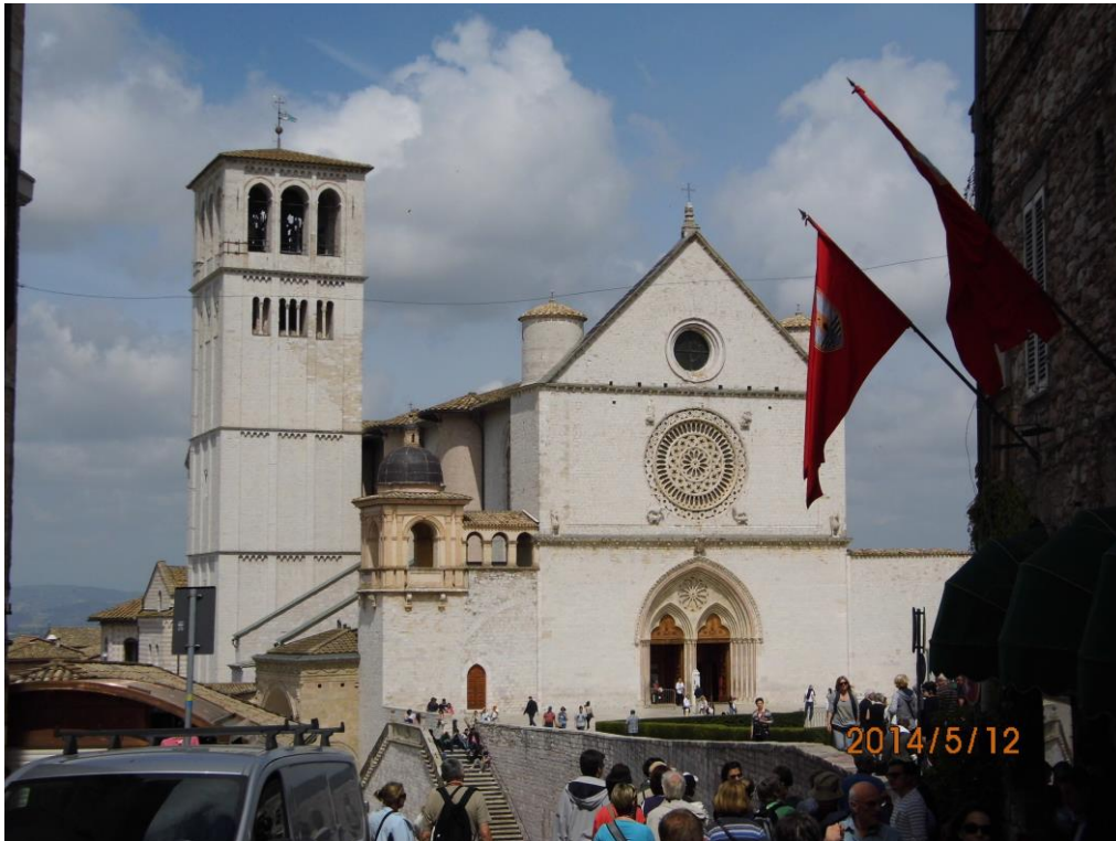
Crkva svetog Franje Asiškoga

Nakon svete Mise, hodočasnici su krenuli na brijeg iznad Porcijunkule na kojem se nalazi srednjovjekovni gradić Assisi. Slijedilo je razgledavanje Crkve Svete Klare , te Crkve svetoga Franje i obilazak i molitva na njihovim grobovima.