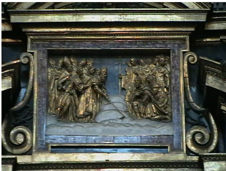
Snijeg na brežuljku Eskvilinu 5. kolovoza 352. godine

Bazilika svete Marije Velike (talijanski: Basilica di Santa Maria Maggiore ) antička je katolička bazilika u Rimu, građena u starokršćanskom stilu. Jedna je od četiri velike ili papinske bazilike koje su se nekad označavale, zajedno s Bazilikom Sv. Lovre izvan zidina, pet "patrijarhalnih bazilika" Rima, povezana s pet drevnih patrijarhalnih sjedišta kršćanstva (Pentarhija). Ostale tri papinske ili velike bazilike su: bazilika sv. Petra, bazilika sv. Ivana Lateranskog i bazilika sv. Pavla izvan zidina. Nalazi u blizini željezničkoga kolodvora. Strop Bazilike je izrađen od zlata donesenoga iz Španjolske, pa se nazivu crkve dodaje i epitet "izrađena od zlata". I danas je utočište španjolskih redovnika. Za nas Hrvate je značajna jer se u njoj nalazi i kapela Pape Sixta V., koji je podrijetlom iz Dalmacije i koji je mnogo učinio za izgradnju tadašnjega Rima.