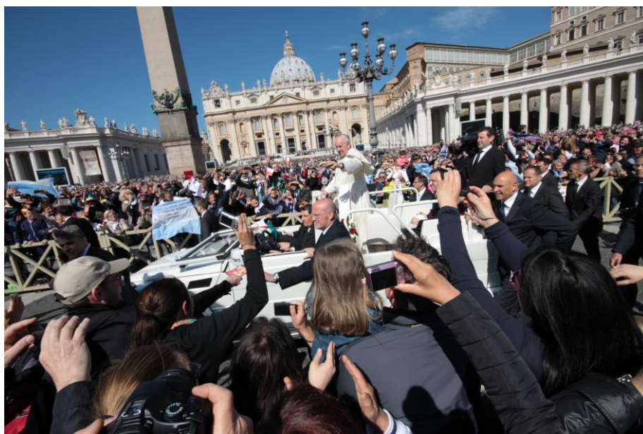
Papa Franjo prolazi pokraj naših hodočasnika

Srijeda, 14. svibnja bio je za sve hodočasnike poseban dan. Vrlo rano ujutro krenuli smo put Vatikana. U 10:30 sati započinje Audijencija svetog Oca pape Franje, pa moramo doći čim prije. No, premda smo došli skoro dva i pol sata prije početka Audijencije, Trg svetog Petra bio je tada već ispunjen ogromnim brojem ljudi iz svih krajeva svijeta, samo iz Italije je došlo preko 300 najavljenih grupa. Mi Hrvati, osim nas Varaždinaca bili smo zastupljeni tek s još jednom hodočasničkom grupom iz Bosne, što smo mogli zaključiti po hrvatskom barjaku Hrvata iz Bosne kojeg su imali, ali su bili jako daleko od nas. No mi Varaždinci bili smo ipak dovoljno blizu prolaza kojim je papa Franjo čak dva puta prošao i uz našu hodočasničku grupu koja ga je radosnim klicanjem pozdravljala, a On nas je sve blagoslivljao.