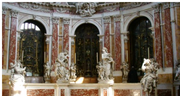
Kapela s relikvijama sv. Antuna Padovanskog

Nakon toga naše hodočašće je krenulo pješice od sv. Leopolda put Bazilike sv. Antuna Padovanskog. Ovdje smo razgledali baziliku, grob i relikvije sv. Antuna, a naši domaćini su nam prikazali i jedan film o svetom Antunu na hrvatskom jeziku.