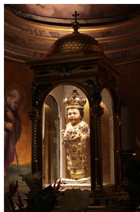
Sveto Dijete - Santo Bambino

U bazilici S. Maria d'Aracoeli susreli smo se sa još jednim tragom hrvatske povijesti u Rimu. Tu je naime pokopana posljednja bosanska kraljica Katarina Kosača-Kotromanić (1424.-1478.). Nakon osvajanja Bosne od strane Turaka i smrti njenog muža, kralja Stjepana Tomaša , kraljica Katarina se preko Kupresa i Dubrovnika povukla u Rim, odakle je do kraja svog života radila na oslobađanju svoje zemlje i obrani svoje vjere. Na njenom grobu ostavili smo jednu hrvatsku svijeću i otpjevali sjevremensku pjesmu naših hrvatskih stradanja „Majko draga, Djevo sveta...”