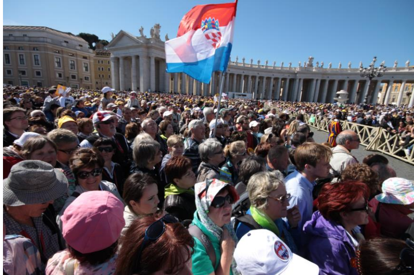
U očekivanju svetoga Oca pape Franje

Nakon svete Mise na ulazu u Katakombe svetog Kalista, naši su hodočasnici pobožno i u sabranosti prošli svetim mjestima kršćana i mučenika vjere prvih četiri stoljeća kršćanstva. Posebno su bili dirljivi pohodi grobovima svete Cecilije i pape Kaja, rodom Solinjanina. Na grobu svetog Kaja, a uz dopuštenje službenoga vodiča kroz Katakombe, smjeli smo i zapjevati.