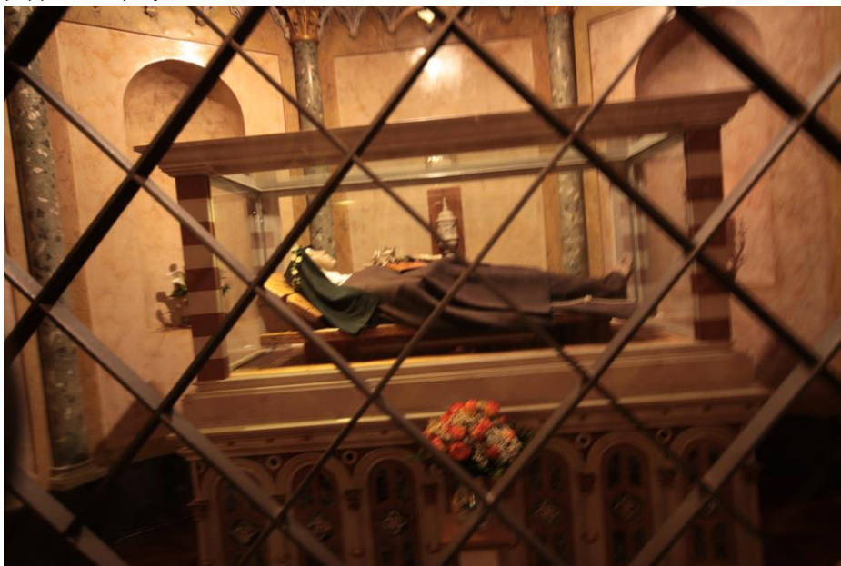
Grob s neraspadnutim tijelom svete Klare

Ta crkvice podno Asiza, postala je okupljalište prvih Franjinih sljedbenika i ishodište franjevaštva. U ovoj maloj crkvice, sv. Franjo je doživio svoje obraćenje i rasvjetljenje kada ga Bog poziva živjeti i propovijedati Evanđelje. U njoj je i osnovan Red manje braće (lat. Ordo fratrum minorum - OFM). U njoj su se braća sabirala, slavila kapitule, a napose molila. U njoj je Franjo primio u bratstvo i sv. Klaru.