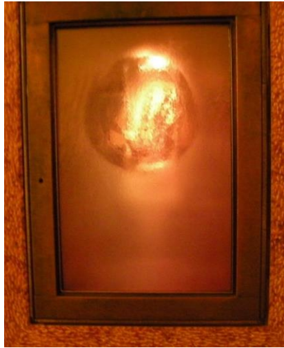
Relikvija desne ruke sv. Leopolda Mandića

U petak, 16. svibnja naši su hodočasnici bili u Padovi. Jutarnju svetu Misu imali smo na grobu sv. Leopolda Mandića.